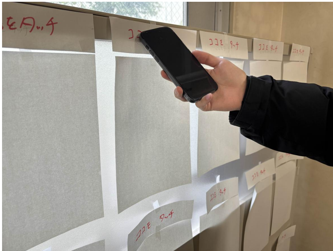
図 2:新歓 Navi-Tap の使用イメージ図