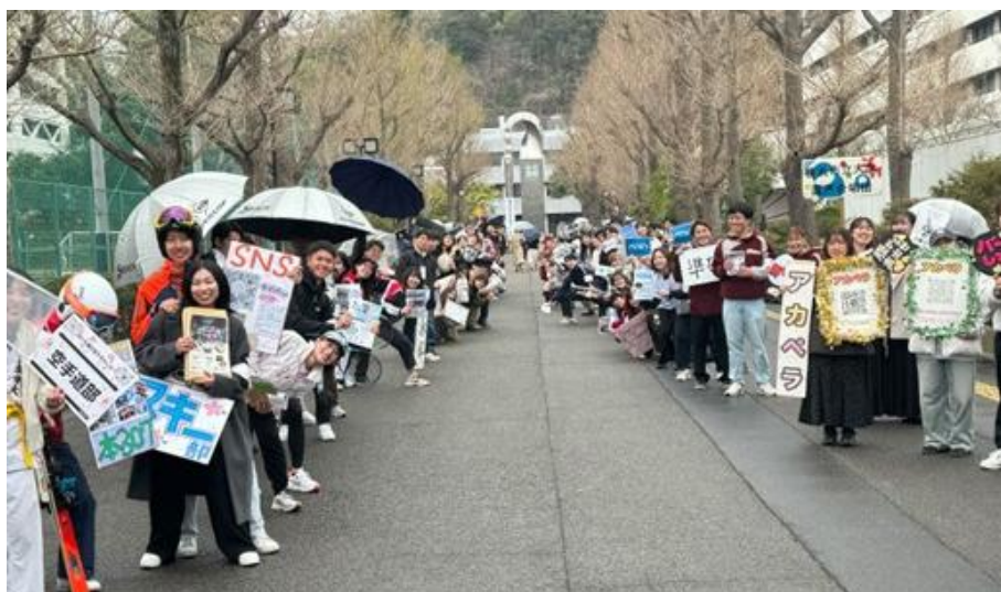
昨年度の HANAMICHI の様子